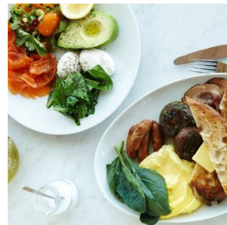
左:フレッシュオージーブラックファースト 右:フルオージーブラックファースト

2017年11月3日（金・祝）、JR大阪駅直結の「LUCUA 1100（ルクア イーレ）」の7Fにオーストラリア・シドニー出身のビル・グレンジャーが手掛けるオールデイカジュアルダイニング「bills」は、関西エリア第一号店となる「bills 大阪」をオープンします。