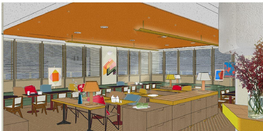
mucham notes PROJECT By William Granger ARCHITECTURE 1-3-3 RYUKA IIR 1-3-3 RYUKA IIR © 2017 bills Japan Co., Ltd.