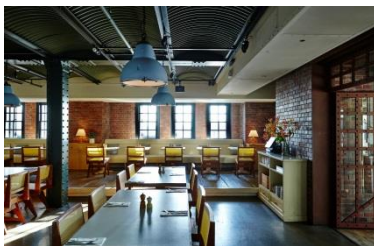
▲bills 横浜赤レンガ倉庫 <<日本2号店>>