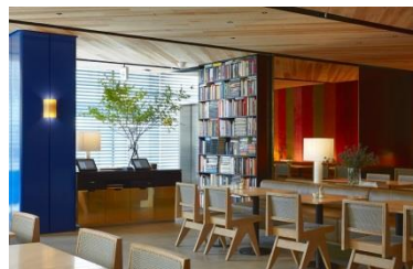
▲bills 二子玉川 <<日本5号店>>