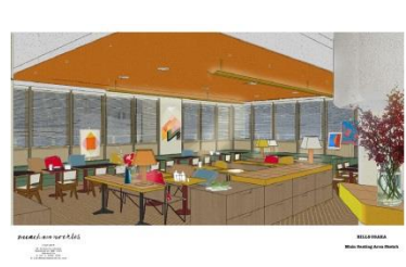
▲bills 大阪 <<日本8号店>>