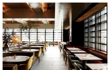
▲bills 銀座 <<日本7号店>>