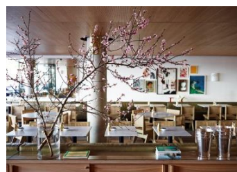
▲bills Bondi Beach