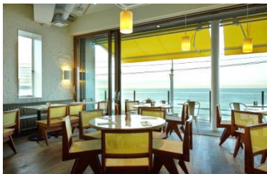
▲bills 七里ヶ浜 <<日本1号店>>