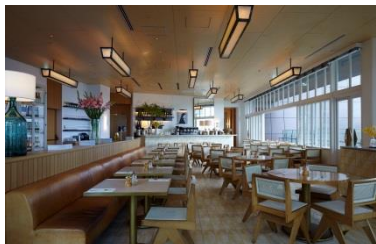
▲bills 表参道 <<日本4号店>>