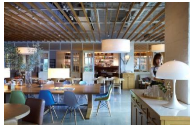
▲bills お台場 <<日本3号店>>