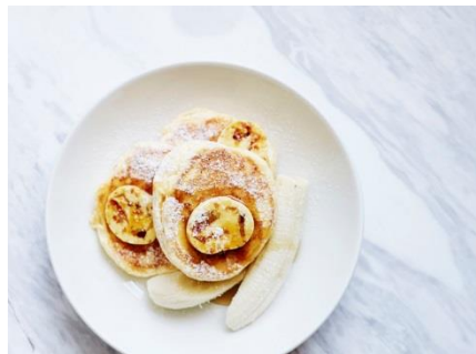
リコッタパンケーキ