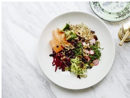
ブラックファーストサラダ