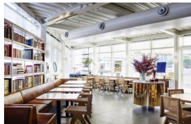
▲bills 福岡 <<日本6号店>>