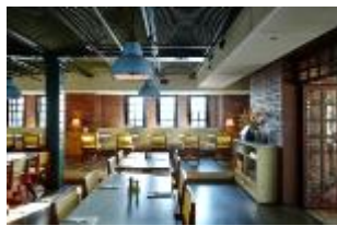
▲bills 横浜赤レンガ倉庫