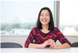
- Women in Leadership -