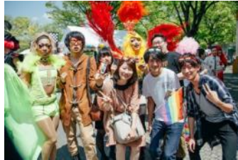
- LGBT -