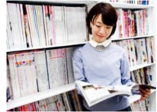
- Inclusion -